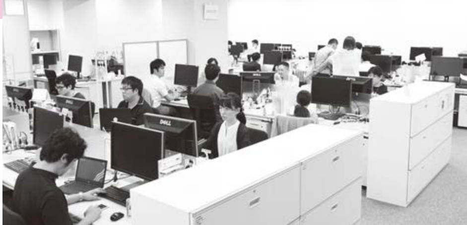
グリーンビジネスオペレーションズの社内。発達障害のある多くの社員が活躍している

ラスや音を遮るヘッドフォンも使用できる。障害のあるなしにかかわらず、働きやすい配慮が満載の最先端のオフィスであるが、一つひとつは特殊なものではなく、どの企業でも導入できるものだった。