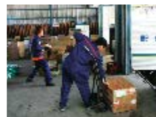
中津川市内の一般雑貨の集配

現在、物流会社は365日、24時間体制でなければ生き残りが困難になりつつあり、名鉄急配も、それに応じたシフト勤務形態を基本としています。このため障害者も、貴重な戦力として、夜勤や時間が変則的な就労になることがあります。その代わり、給与・待遇面で、健常者との違いはありません。