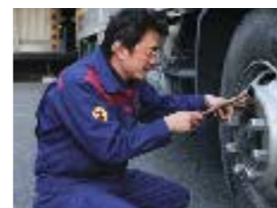
整備点検は習慣になってます