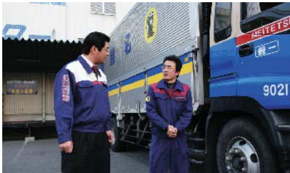
安全運転を誓って幹線輸送に出発!

名鉄急配は名鉄運輸グループの一員で、中京地域を中心に自動車運送業、倉庫業等を展開しています。主な得意先は、大手家電量販店やコンビニエンスストア、大手電機メーカーなど。ジャスト・イン・タイムの輸送に加え、顧客のニーズにきめ細かく対応できる柔軟性も求められます。障害者の雇用について、多少の不安はあるそうです。