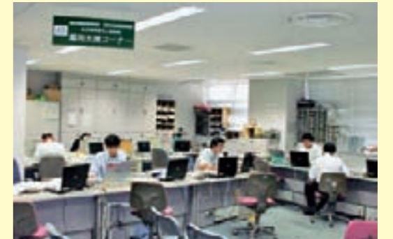
▲事業主相談コーナー