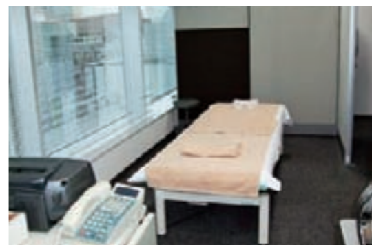
▲マッサージルーム