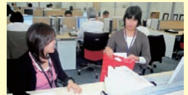
▲必要なサポートは部内メンバーに積極的にはたらきかける