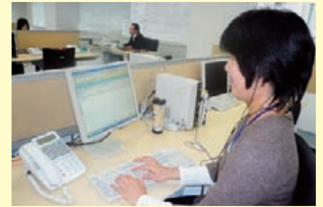
▲パソコンを使用したデータ管理

業務を行うにあたって、手順を何度か教えてもらった後は、必要に応じて独自マニュアルを作成しています。