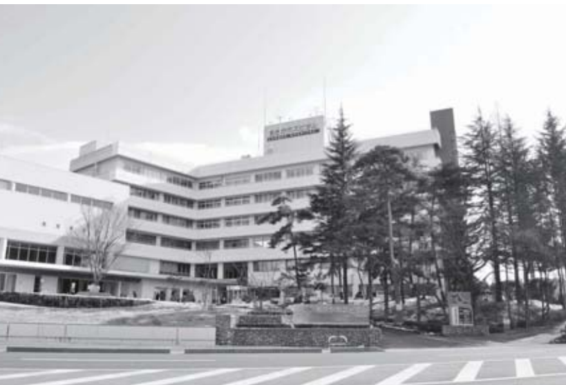
福島県・郡山市にある「あさかホスピタル」

「あさかホスピタルグループ」は、医療福祉にかかわる5つの法人を福島県郡山市、本宮市、三春町の3市町で運営している。あさかホスピタルを中心とする医療法人安積保養園、社会福祉法人の安積愛育園と安積福祉会、NPO法人アイ・キャン、そしてこの4つの法人の給食や清掃、売店などを一手になう有限会社アサカサービスセンターがあり、医療福祉サービスを総合的に提供するグループである。 今回はあさかホスピタルのほか、介護つき有料老人ホームと、NPO法人アイ・キャンが運営する2つの事業所の合計4カ所を取材した。