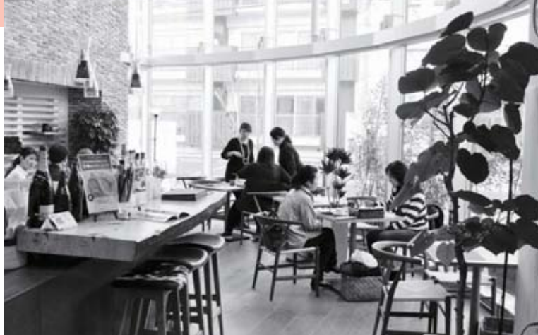
レストラン「パール・イルチェントロ」

うかがった。グループ法人が運営する農場でつくった食材を使ったメニューと、菓子工房ドルチェブオーノ、パン工房のブオーノブオーノが提携しながら、地域の方々に美味しい料理を提供しているお店である。14時を過ぎた一番すいている時間帯に訪